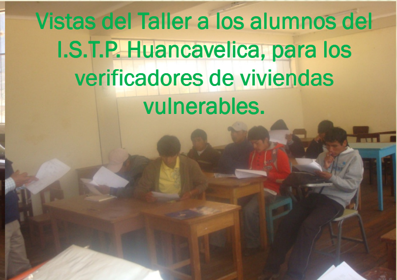
Vistas del Taller a los alumnos del I.S.T.P. Huancavelica, para los verificadores de viviendas vulnerables.