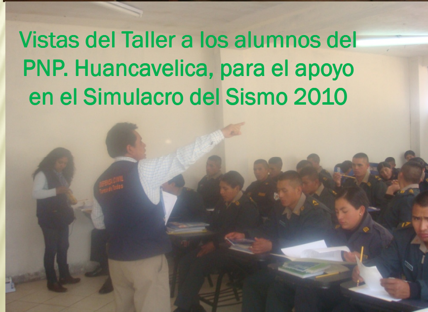
Vistas del Taller a los alumnos del PNP. Huancavelica, para el apoyo en el Simulacro del Sismo 2010